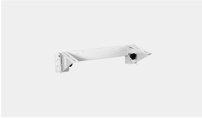
ART.161:STAFFA LAVABO DISABILE CON REGOLAZIONE MANUALE